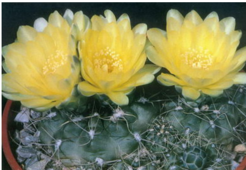
Figure 5 : Gymnocalycium andreae , un des plus populaires du genre pour ses fleurs jaune-beurre

Même négligés, ils semblent rarement prédisposés à pourrir, y compris en cas de sur-arrosage. Et dans ce cas-là, ils se séparent purement et simplement de leur système racinaire, tout en laissant suffisamment de temps à leur propriétaire pour découvrir leur problème, les repoter et mieux connaître leurs besoins. Ils toléreront de plus une luminosité médiocre, même si celle-ci peut entraîner une production de fleurs moindre.